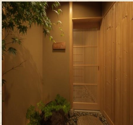
凛とした佇まい「拓」の入口

なんとこのお店・・・ 新潟ガストロノミーアワード2026 飲食店部門で最高位「DIAMOND」を受賞されたのです！