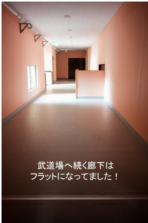
武道場へ続く廊下は フラットになってました！