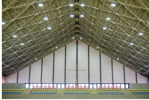
三角窓はなくなり競技中はまぶしくなさそう