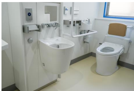
トイレもきれいに明るくなりました♪