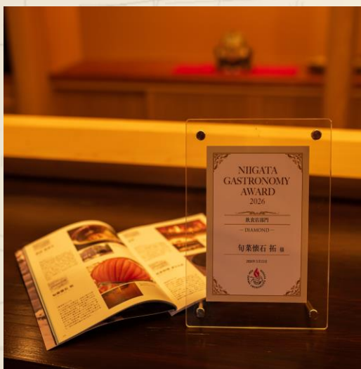
受賞トロフィーと掲載誌♪