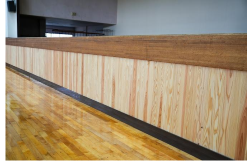
オリパラ資材の地域還元・再利用