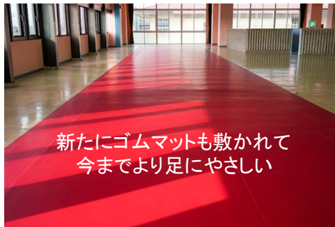
新たにゴムマットも敷かれて 今までより足にやさしい