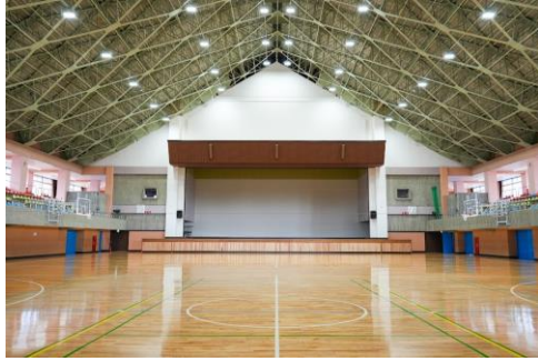
館内のすべての照明はLED化され 明るく快適な空間に

待ちに待った荒川体育館がついに 令和8年5月1日(金)より利用再開になりました！ そこで最近めっきり運動不足ぎみの主婦Yが 一足お先に館内に潜入してまいりました😊 新しくなった体育館で、ぜひ気持ちよく体を動かして みませんか♪