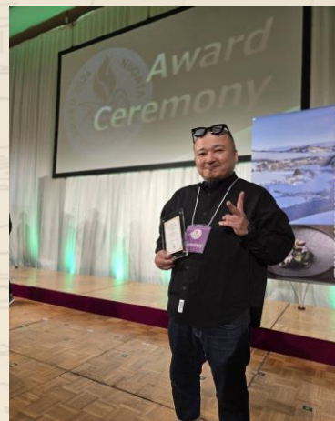
授賞式の様子（店主より拝借）

現在「旬菜懐石 拓」はとても豊かな村 上市の食材を使って料理を作っています。 肉や魚だけでなく、ジビエや山菜を 使った料理も多くあります。 山菜は自分で採りに行くようです♪ とにかく地元食材への愛が強い！