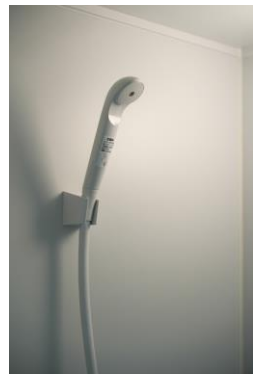
シャワーも使えます。 ジョギング後に汗も流せば 帰りにスーパーよれちゃう♪