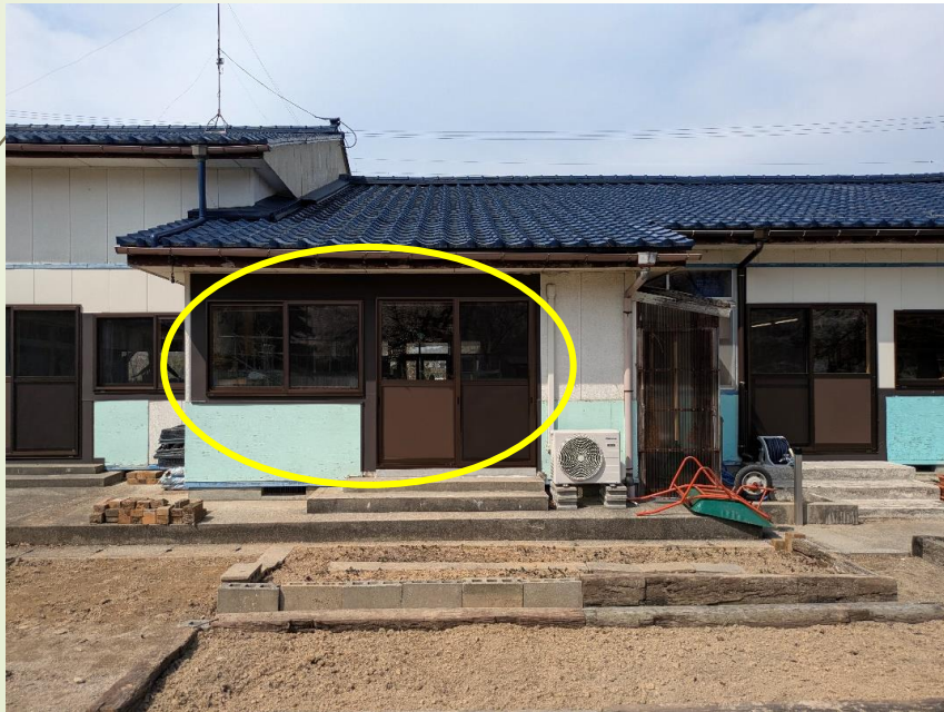
▲ 事務室サッシ取替工事