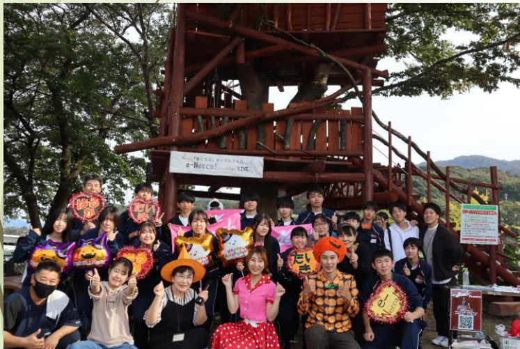
▲オータムフェスに参画