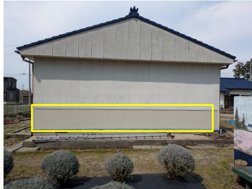
▲ 外壁一部張替え工事