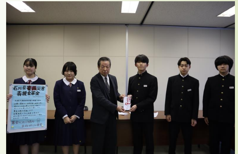
▲収益金を能登半島地震義援金として寄付