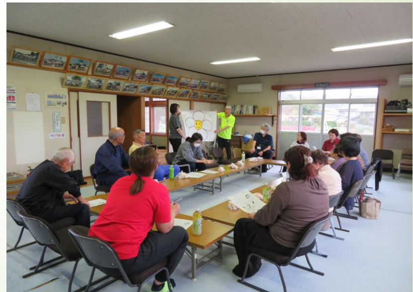
▲ 隊員による地域訪問