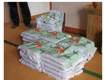
▲坂町地区 友愛訪問