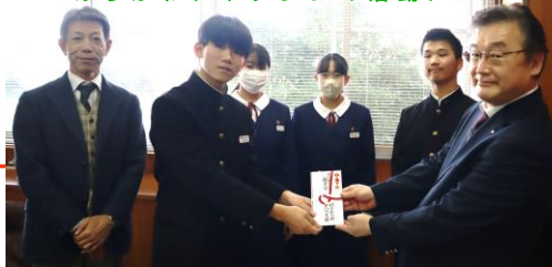
▼村上法人会荒川支部から寄付 ～あらかわチャレンジの活動に～