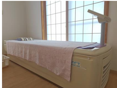
▲電気治療の機器を腰に利用しているところ。 ▲水圧で施術を行うベッド。