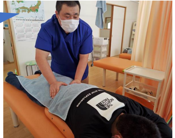
お客様に同意をいただき、施術している様子を撮影。