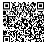
ご意見様式フォーム

※ご提供いただいた個人情報は、他の目的に利用・提供しないととも適正に管理します。