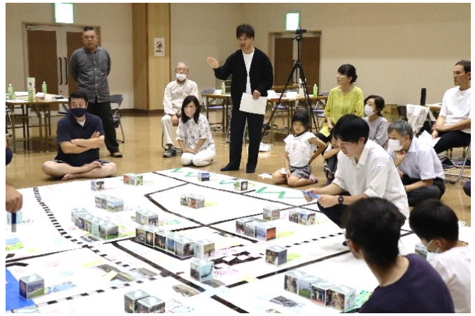
第2次まちづくり計画策定