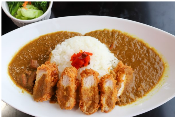
特製肉厚かつカレー 1,290円