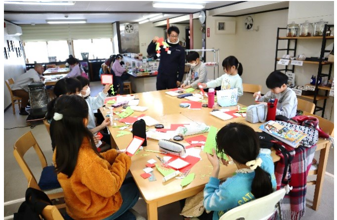
わんぱく子ども教室