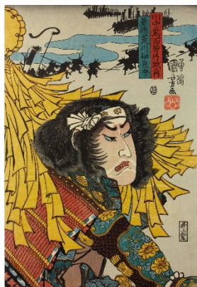
「荒川伊豆守浮世絵」大英博物館所蔵 © The Trustees of the British Museum