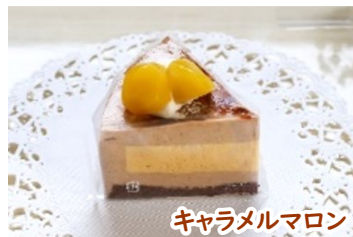
キャラメルマロン