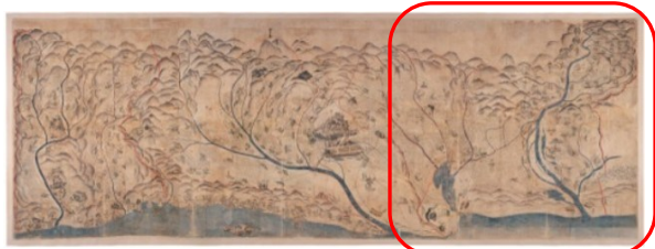
「越後国瀬波郡絵図」

越後国の郡絵図は、豊臣秀吉の命を受けて作成され、その一つが「瀬波郡絵図」になります。米沢市上杉博物館に国の重要文化財として所蔵されています。大学の研究材料や東京大学史料編纂所にも取り上げられています。