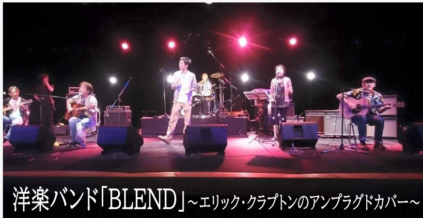
洋楽バンド「BLEND」～エリック・クラプトンのアンプラグドカバー～

※ 十分なコロナ感染対策を行いながら実施いたしますが、市内の感染拡大状況によりイベントが中止となる場合があります。