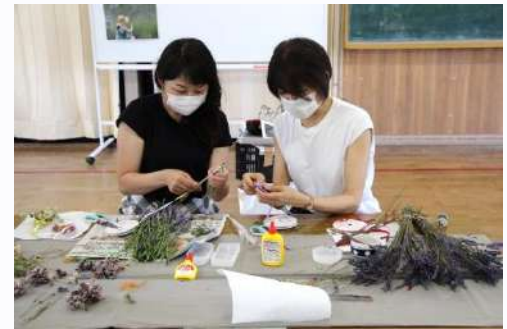
ラベンダースティックづくり