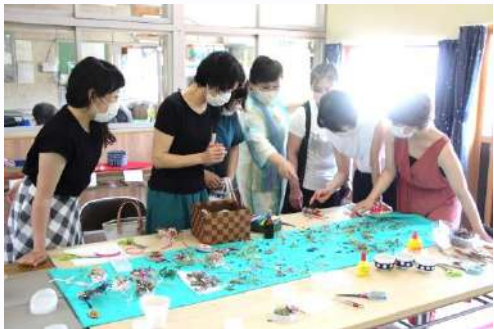
アロマワックスバーづくり