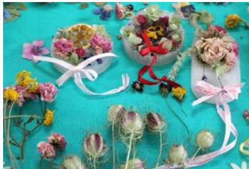
アロマワックスバー