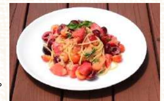
チェリーを入れても美味しいよ!