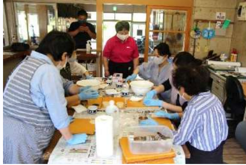
ラベンダー石けんづくり