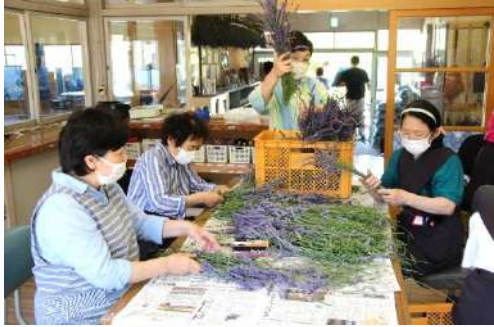
ラベンダーの販売

訪れたお客様は、ハーブメイツあらかわと、Garden Labo.のメンバーと一緒に、ラベンダー石けんづくりや、ラベンダースティックづくり、アロマワックスバーづくりなどを楽しみました。また、藍染の染め物展示や小物雑貨の販売会も行われ、和やかなムードのなかスタッフもお客様もそれぞれが思い思いに楽しんでいました。