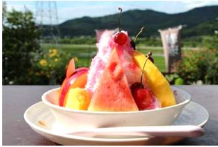
フルーツフラッペ(750円)