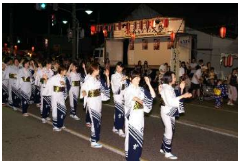
あらかわの「民謡流し」といえば「あらかわ音頭」

久々のリサーチは、地元に関わるこんな話題。確かに昔からあらかわにいる人は知っているかもしれないが、若い世代の方々には、ちょっと馬鹿染みがないかもしれない。……ってことで、今回はそんな「あらかわ音頭」の歌い手をリサーチしたぜ!!!!