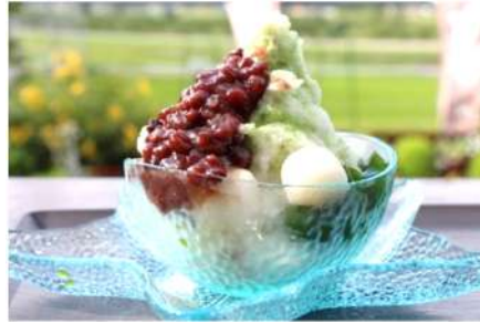
抹茶ミルク金時白玉付き(550円)

村上市貝附1043 営業時間 11:00~17:00 電話 0254-62-4086 定休日 月曜日と第2、第4火曜日