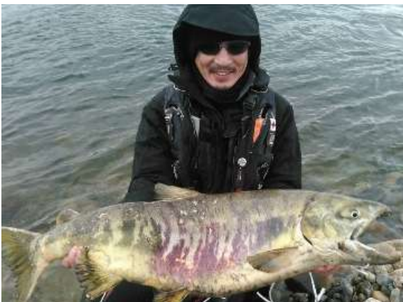
こんな人が釣れちゃいます!!

あらかわのサケ釣りは、釣り好きのニーズにがっちり応え、 サケのように毎年あらかわに来るお客さんに支えられていた!