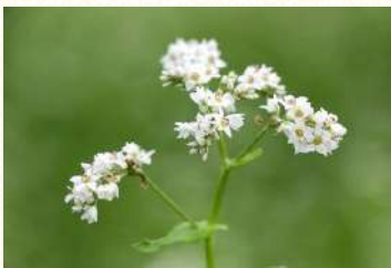
▲小さく可愛い花が咲く

-虚空蔵平そばの販売場所- よれっしゃこいっちゃん 村上市田端町8-28 TEL0254-75-5550