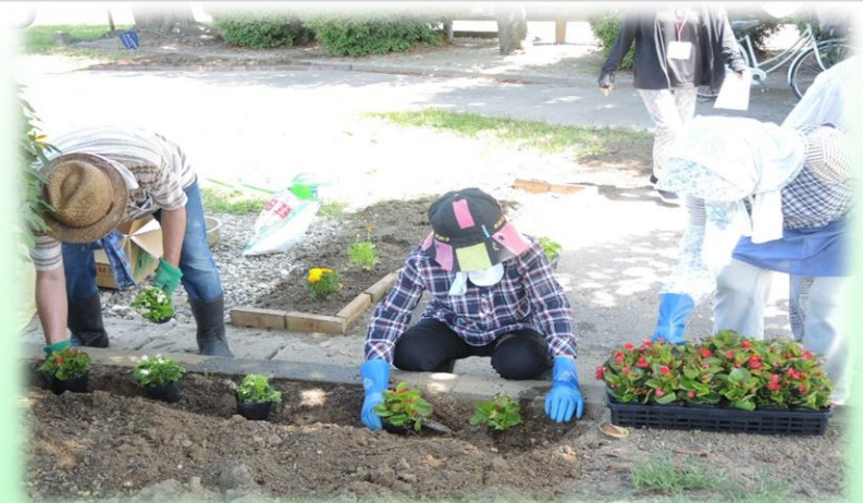
▼ 花満開の前坪公園