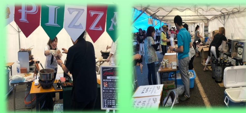
▲エキマエビアガーデンの様子