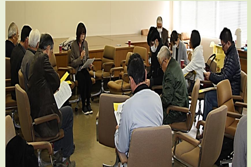
▲次年度の説明会の様子