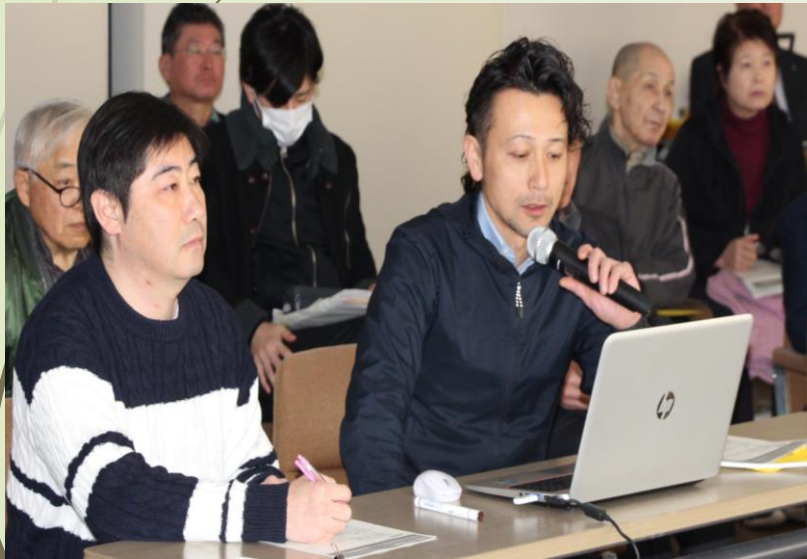
▲充実した1年の取り組みを発表していただきました！

30年度に助成を受けた一般部門4団体、チャレンジ部門1団体から、それぞれの取り組みについて報告いただき、その後、31年度の事業説明会を開催しました。