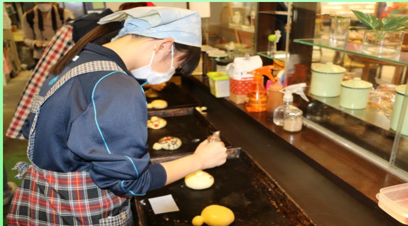
▲おいしいパン作り体験