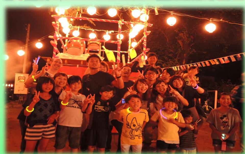
▲十文字夏祭り（盆踊り）の様子