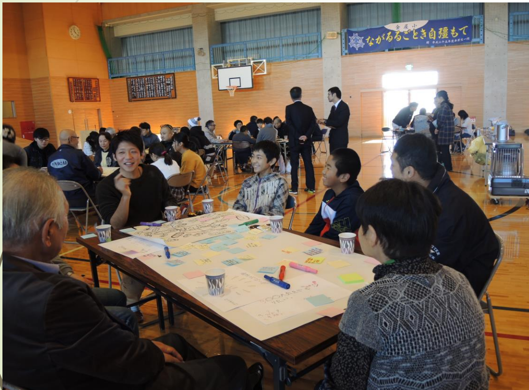
▲ 「小学生と金屋地区を考える会」の様子

集落支援員の活動を小学生の地元に対する愛着の育成。そこから活動を起こそうという人材の発掘の面から協力した。