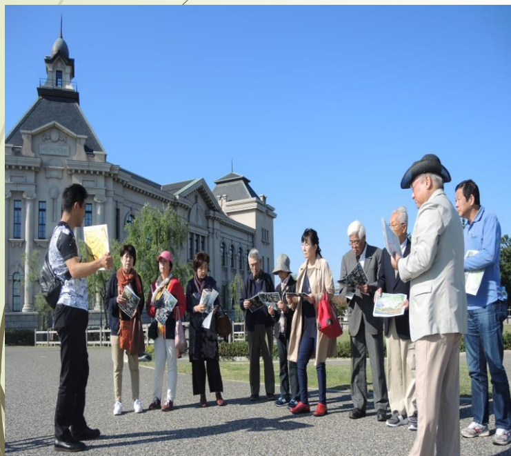
▲ 視察研修の様子 ▶