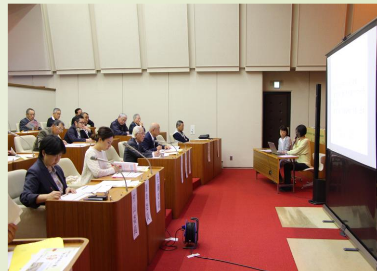
▶公開審査会の様子