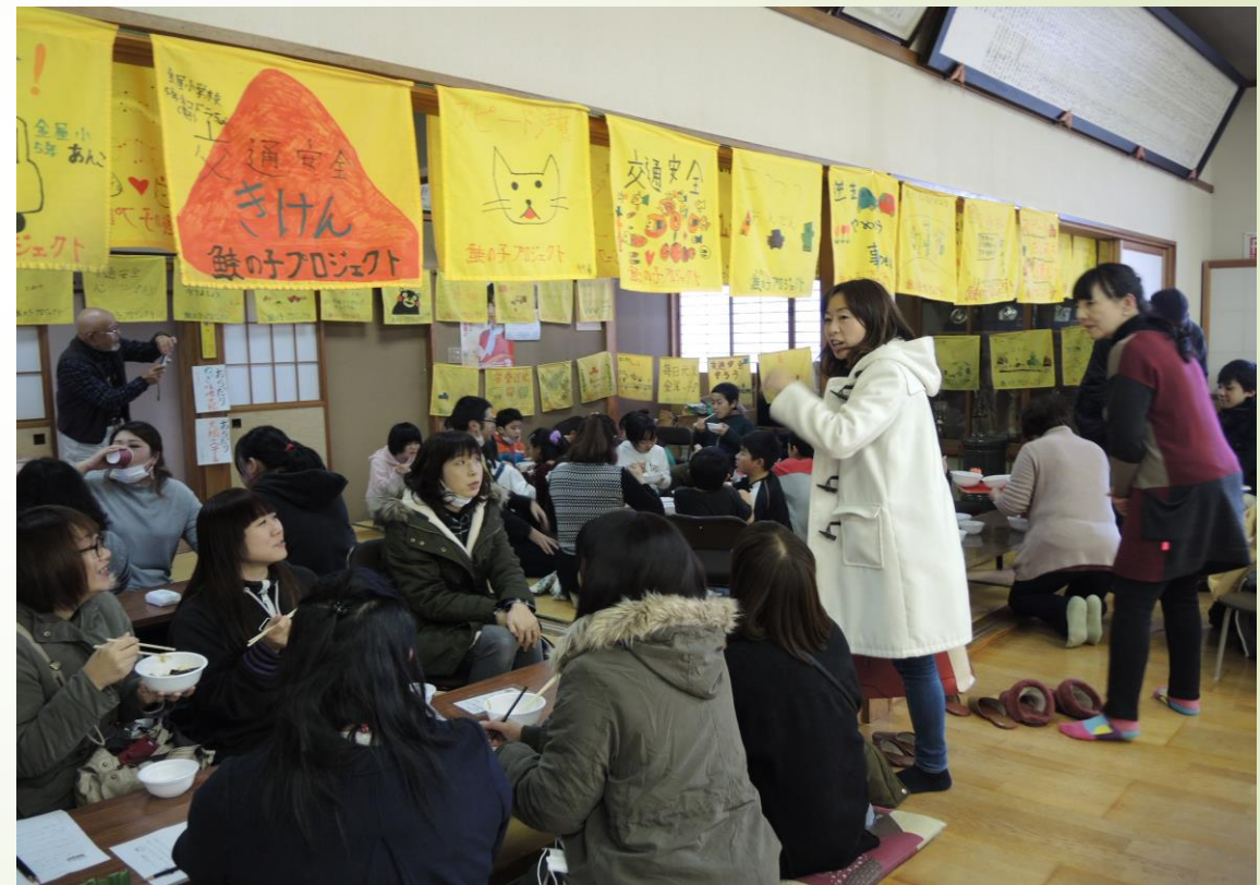
▲ つどい場「おらだり」の様子